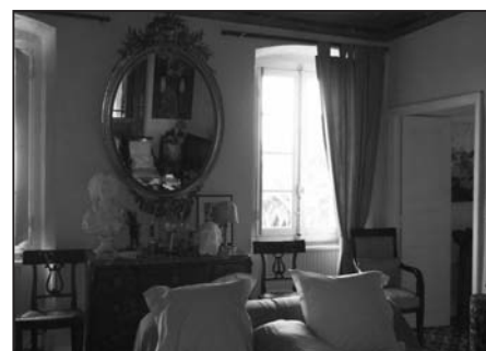
Le cachet d'un intérieur d'époque