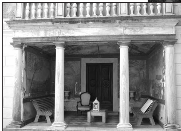
L'entrée de la villa et son superbe atrium