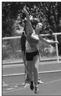
Une lanceuse du CAA