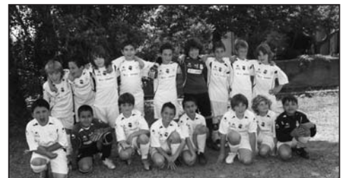
Joueurs de L'Etoile