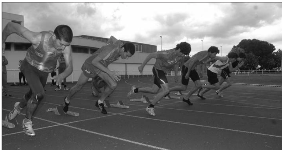
Départ du 100m Cadets

Heureusement, le lendemain, le soleil – malgré un léger vent – devait permettre à la compétition de se dérouler dans de bien meilleures conditions.