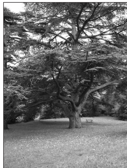
Le cèdre de l'immense parc