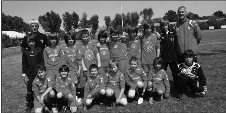
Furiani a su tirer son épingle du jeu