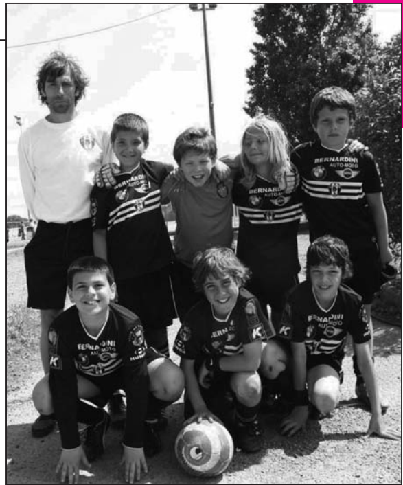
Jeunes footballeurs du CAB