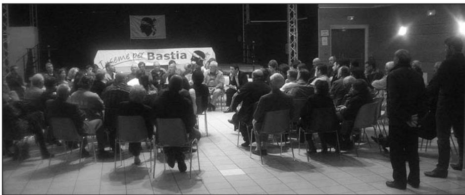
L'assemblée générale statutaire d' Inseme per Bastia , à la salle polyvalente de Lupino, à Bastia, le 12 mai 2010

Force est de constater que la majorité en place nous ferme systématiquement toutes les portes. Ceci est l'une des raisons qui limitent considérablement notre action d'élus au sein du conseil municipal. Même si nous mettons un point d'honneur à être présents à l'ensemble des séances et à travailler de façon active. Il y a sans conteste de la part de la majorité en place un refus total d'associer l'opposition aux décisions majeures de la ville. Sachant que nous avons adressé à Monsieur le Maire une trentaine de cour-