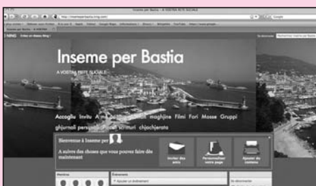
Internet, autre outil de communication privilégié