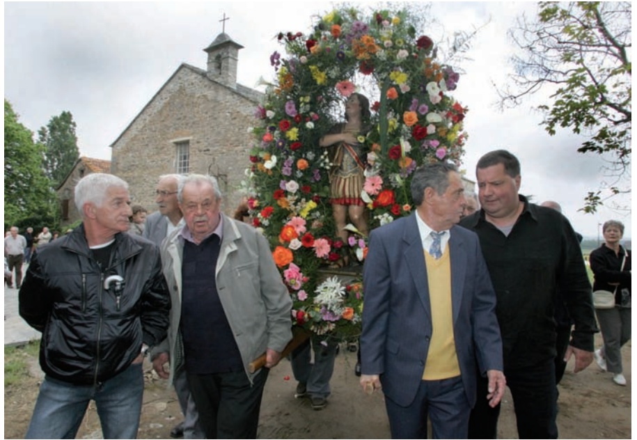
A pruceddu un campu di fiera : trà zitelli è anziani, listessa devuzione