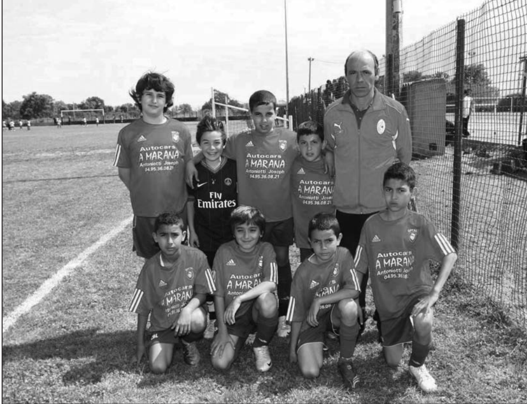
Des représentants du GFCBL, organisateur de la rencontre

Concernant les rencontres, elles furent très indécises durant quatre journées. Les demi-finales et finales encouragèrent les braves car ces chocs indécis furent d'une grande sportivité.