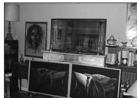
Des tableaux partout