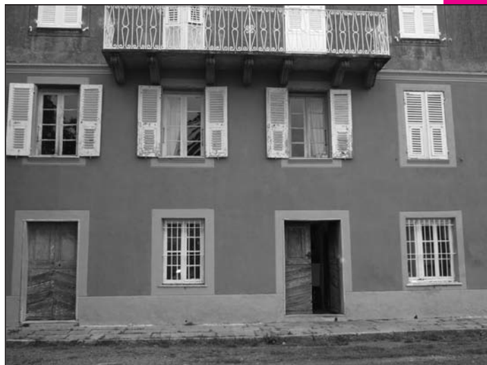
Une des façades de l'édifice inscrit au catalogue de l'Unesco

A partir de 10 h, pendant ces deux journées, des animations vont se succéder : initiation aux danses latino-américaines, à la salsa notamment. Peintures, sculptures et autres productions seront visibles dans les pièces de la maison, au premier étage, dans le parc, accrochées aux arbres, auprès des fleurs, des massifs, sculptures végétales, partout où l'art peut être en osmose avec la nature. Un festival pour des rencontres, pour voir les autres, pour être hors de soi, partager, apprendre. Pour faire un plein d'imagination. Pour reconstruire un autre monde.