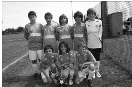
L'équipe de Pieve di Lota

Les jeunes Bastiais du SC Bastia ont souffert lors de cette finale face à de solides joueurs bigugliais qui ont plu par leur vaillance et leur volonté. Une débauche d'énergie qui ne donnait rien. Il a fallu attendre les tirs au but pour désigner le vainqueur et, à ce jeu, les Bastiais parvinrent à s'octroyer le trophée 1 à 0 devant de jeunes Bigugliais déçus par ce revers.